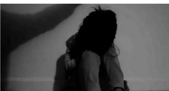
આરોપીએ ટ્રેન નીચે પડતું મૂકી આપઘાતનો પ્રયાસ કરતા ઈજાગ્રસ્ત થયો હતો, હાલ તે

જામનગરના નવા નાગના ગામમાં રહેતી અને ધોરણ ૧૦માં અભ્યાસ કરતી વિદ્યાર્થિની પર તેના પરિવાર શખસે દુષ્કર્મ આચર્યું હતું. સગીરા ગર્ભવતી બનતા આ મામલો સામે આવ્યો હતો. જે બાદ સગીરાની માતાએ આરોપી સામે બેડી મરીન પોલીસ મથકમાં દુષ્કર્મ અંગેનો ગુનો નોંધાવ્યો હતો. આ ફરિયાદ નોંધાવ્યા બાદ