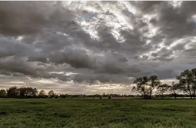
રાજ્યના વિવિધ વિસ્તાર પૈકી મધ્ય ગુજરાતમાં પંચમહાલ, દાહોદ, છોટાઉદેપુર, વડોદરા તથા દક્ષિણ ગુજરાતના ભરૂચ,

લો પ્રેસર આઈકલોનિકના કારણે તા.૧થી ૪ ફેબ્રુઆરી દરમિયાન રાજ્યના વિવિધ વિસ્તારોમાં કમોસમી વરસાદ અથવા વાદળછાયું વાતાવરણ રહેવાની આગાહી હવામાન વિભાગ દ્વારા વ્યક્ત કરવામાં આવી હતી. જે અંતર્ગત આજે વડોદરાના હવામાનમાં અચાનક પલટો આવ્યો હતો અને આકાશ વાદળોથી ઢંકાઈ ગયું હતું.