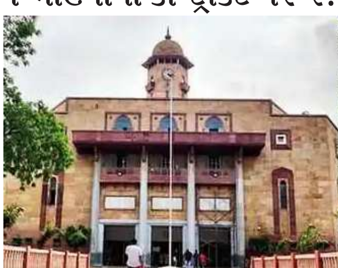
અલગ અલગ ૧૮ પોસ્ટ પર ભરતીની જાહેરાત કરવામાં આવી છે. જેમાં ૧૪,૮૦૦ રૂપિયાથી ૨.૦૮ લાખ સુધીનો પગાર ધોરણ રાખવામાં આવ્યું છે. ઉમેદવારને લાયકાત મુજબ પસંદગી થયા બાદ ભરતી કરવામાં આવશે. ગુજરાત યુનિવર્સિટી દ્વારા જે ૧૮ પોસ્ટ પર ભરતીની જાહેરાત કરવામાં આવી છે. તેમાં એસોસિયેટ પ્રોફેસર, એસોસિયેટ પ્રોફેસર અને ડેપ્યુટી ડાયરેક્ટર, આસિસ્ટન્ટ

ગુજરાત યુનિવર્સિટી દ્વારા તાજેતરમાં વિવિધ પોસ્ટ પર ભરતીની જાહેરાત કરવામાં આવી છે. આ ભરતીની જાહેરાતમાં ડેપ્યુટી રજિસ્ટ્રારની જાહેરાત પણ આપવામાં આવી છે. યુનિવર્સિટીમાં પ્રથમ વખત ડેપ્યુટી રજિસ્ટ્રારની કોન્ટ્રાક્ટ આધારિત ૧૧ મહિના માટે ભરતી કરવામાં આવશે, જેનો પગાર ૨,૦૮,૦૦૦ સુધીનો રહેશે. આ ભરતી ઓનલાઈન કોર્સ માટે કરવામાં આવશે. ગુજરાત યુનિવર્સિટી દ્વારા વિવિધ ૧૮ પોસ્ટ પર ૪૦થી વધુ ભરતી માટેની જાહેરાત કરવામાં આવી છે. ઊંઝા નિયમ મુજબ ગુજરાત યુનિવર્સિટીમાં ઓનલાઈન કોર્સ શરૂ કરવામાં આવ્યા છે. આ ઓનલાઈન કોર્સ માટે ડેપ્યુટી રજિસ્ટ્રારની લઈને સ્ટાફ સુધીની