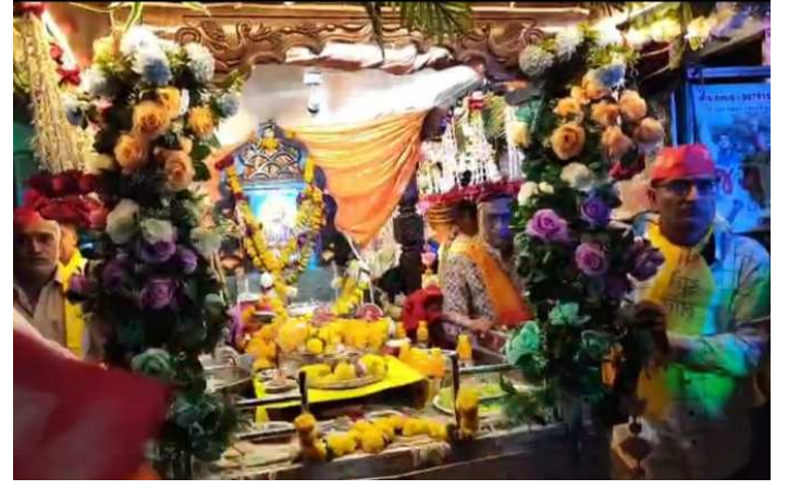
અને ઉલ્લાસભર ઉજવણી કરાઈ હતી. -અખંડ ભારત

દાહોદ શહેરમાં સિંધી સમાજ, સિંધી શક્તિ ગ્રૂપ અને શ્રી સ્વામી લીલાશાહ સિંધી સમાજ નવયુવક મંડળ, દાહોદ દ્વારા ચેટીયાંદ પર્વની ધામધુમથી ઉજવણી કરવામાં આવી હતી. ભગવાન ઝુલેલાલની શોભાયાત્રા સાંજે ૪ કલાકે દર વર્ષની જેમ આ વર્ષે પણ દાહોદ શહેરની આત્મનંદ સોસાયટી લક્ષ્મી મીલ, રેલ્વે સ્ટેશન રોડ, સિંધી સોસાયટી પહોંચી પુજા વિધી સંપન્ન થઈ હતી આ પહેલા પણ વિવિધ કાર્યક્રમોનું આયોજન કરવામાં આવ્યું જેમાં પૂજા, આરતી, પ્રસાદીનું આયોજન કરવામાં આવ્યું હતું. દાહોદ સિંધી સમાજ દ્વારા ચેટીયાંદ પર્વની ઉમંગ