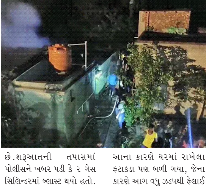
૧. શરૂઆતની તપાસમાં પોલીસને ખબર પડી કે ૨ ગેસ સિલિન્ડરમાં બ્લાસ્ટ થયો હતો. આના કારણે ઘરમાં રાખેલા ફટકડા પણ બળી ગયા, જેના કારણે આગ વધુ ઝડપથી ફેલાઈ ગઈ. આ ઘટનામાં ૭ લોકોના મોત થયા હતા. પોલીસ વધુ તપાસ કરી રહી છે કે ઘરમાં ફટકડા બનાવવાનો કોઈ ગેરકાયદે ધંધો ચાલી રહ્યો હતો કે કેમ. બચાવ કાર્ય પૂર્ણ થયું, પોલીસ તપાસમાં વ્યસ્ત પોલીસ જણાવ્યું કે આગની માહિતી મળતા જ ફાયર બ્રિગેડ અને પોલીસની ટીમ ઘટનાસ્થળે પહોંચી ગઈ હતી. સ્થાનિક વહીવટીતંત્રની મદદથી રાહત અને બચાવ કામગીરી શરૂ કરવામાં આવી હતી. હવે પરિસ્થિતિ નિયંત્રણમાં છે. આગ પર કાબુ મેળવી લેવામાં આવ્યો છે.

પશ્ચિમ બંગાળના દક્ષિણ ૨૪ પરગણા જિલ્લાના પાથર પ્રતિમા વિસ્તારમાં સોમવારે રાત્રે ગેસ સિલિન્ડર વિસ્ફોટમાં સાત લોકોના મોત થયા હતા. મૃતકોમાં ૪ બાળકો અને ૨ મહિલાઓનો સમાવેશ થાય છે. જ્યારે, એક ઘાયલ મહિલાને સારવાર માટે હોસ્પિટલમાં દાખલ કરવામાં આવી છે. સુંદરબન જિલ્લાના એસપી કોટેશ્વર રાવના જણાવ્યા અનુસાર, આ અકસ્માત રાત્રે ૯ વાગ્યે પાથર પ્રતિમા બ્લોકના ઢોલાઘાટ ગામમાં થયો હતો. બધા મૃતદેહો મળી આવ્યા છે. મૃત્યુ પામેલા લોકો એક જ પરિવારના