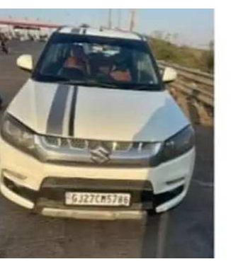
દ્વારા એક કારમાં અલગ અલગ ચોરખાના બનાવીને તેમાં ઈંગ્લિશ દારૂની બોટલોનો જથ્થો સંતાડી જામનગર શહેરમાં ઘુસાડવામાં આવી રહ્યો છે, જે બાતમીના આધારે ગઈકાલે

જામનગરની લોકલ કાર્ટમ બ્રાન્ચની ટીમે ચોક્કસ બાતમીના આધારે સોયલ ટોલનાકા પાસે વોચ ગોઠવી કારની અંદર બનાવેલા જુદા જુદા ૮ ચોર ખાનામાં સંતાડેલો ૫૬૩ નંગ નાની ઈંગ્લિશ દારૂની બોટલોનો જથ્થો કબજે કરી લઈ બે આરોપીઓની અટકાયત કરી છે. અને રૂપિયા ૫.૬૭ લાખની માલમત્તા કબજે કરી લીધી છે. જામનગરની લોકલ કાર્ટમ બ્રાન્ચની ટીમે ચોક્કસ બાતમી મળી હતી, કે જામનગરના જ વતની બે શખ્સો