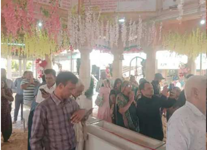
ઊંઝા નજીક આવેલા ઐઠોર ગામના સુપ્રસિદ્ધ ગણપતિ મંદિરમાં ત્રિદિવસીય મેળાનો પ્રારંભ થયો છે. ૩૧ માર્ચથી ૨ એપ્રિલ ૨૦૨૫ સુધી ચાલનારા આ ભવ્ય શુકન મેળામાં મોટી

સંખ્યામાં શ્રદ્ધાળુઓ દર્શનાર્થે ઉમટ્યા છે. મેળાની ખાસ વિશેષતા એ છે કે દરેક ભક્તને ૩૫ ગ્રામ વજનનો શુદ્ધ ઘીનો લાડુ પ્રસાદ રૂપે આપવામાં આવશે. સંસ્થા દ્વારા અત્યાર સુધીમાં ૪૫ હજાર લાડુ પેકિંગ સાથે તૈયાર કરવામાં આવ્યા છે. સંસ્થાનું આયોજન છે કે દર્શન કરવા આવનાર દરેક ભક્તના ઘર સુધી લાડુનો પ્રસાદ પહોંચે. આજે મોડી સાંજે વર્ષકળના શુકન જોવામાં આવશે. આ શુકન પરથી આવનારું વર્ષ કેવું જશે તેનો અંદાજ મેળવી શકાશે.